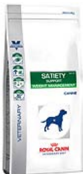
Пакување од 1,5кг;5кг;12кг