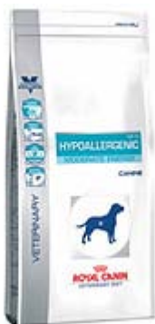
Пакување од 1,5 кг; 7кг.

Наменета за кучиња со прекумерна тежина, кастрирани и постари кучиња со следниве Индикации: