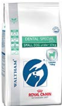
Пакување од 2кг.