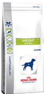
Пакување од 1,5кг;5кг;14кг.