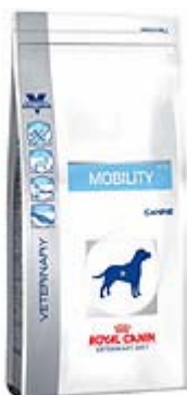
Пакување од 6 кг. и 14 кг.

Индикации: Помош при одржување на подвижноста на зглобовите кај возрасни кучиња.