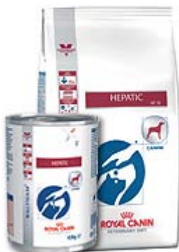
Пакување 1,5кг, 7кг и 14кг.