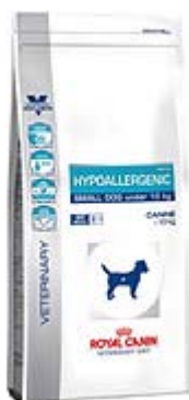
Пакување од 1кг. и 3,5 кг.

Наменета за кучиња до 10кг. со следниве Индикации: