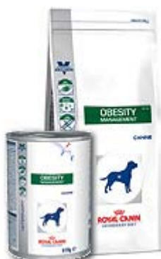
Пакување од 1,5кг;6кг;14кг.