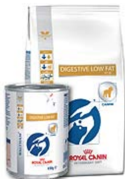
Пакување од 1,5 кг; 5кг; 12кг