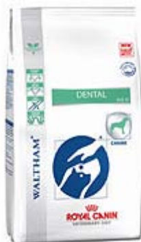
Пакување од 7кг.