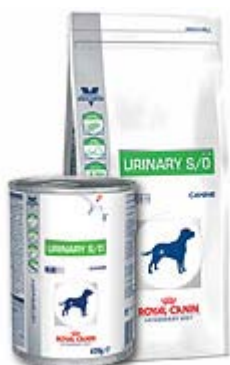
Пакување 2кг и 7 кг.