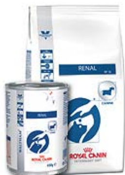
Пакување од 2кг;7 кг; 14 кг.