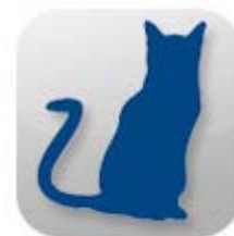
KITTEN & NEUTERED CAT